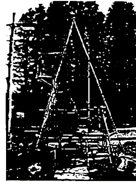
図-1-1 ボーリング (陸上)