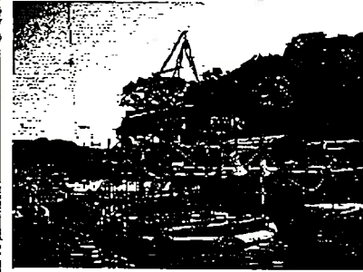
図-1-2 ボーリング (湖沼上)