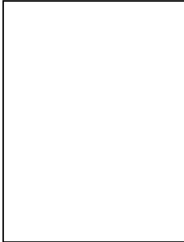
改造後(トイレ内部)