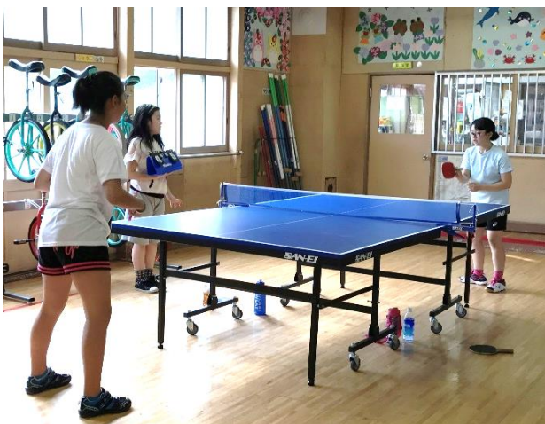
新しい卓球台で真剣勝負！