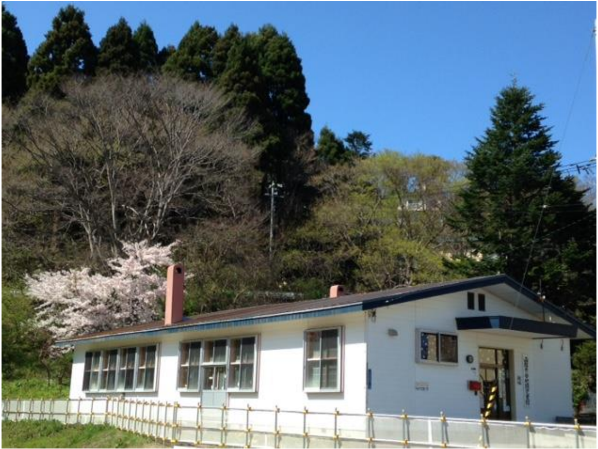
児童館全景（児童館裏には桜の木があり、心をなごませてくれます）

谷地頭児童館は函館山の麓に位置し、まわりには「函館八幡宮」「函館公園」「立待岬」などの観光スポットがあり、豊かな自然環境に恵まれています。