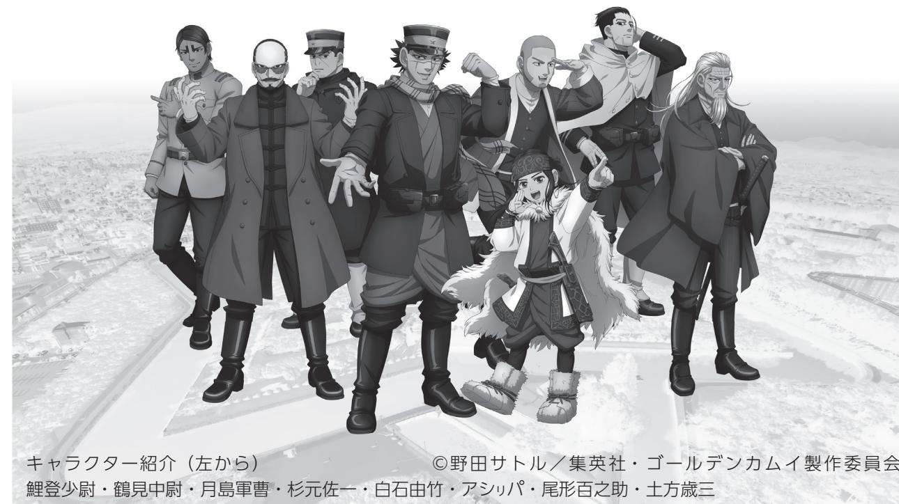
キャラクター紹介 (左から) ©野田サトル/集英社・ゴールデンカムイ製作委員会 鯉登少尉・鶴見中尉・月島軍曹・杉元佐一・白石由竹・アシッパ・尾形百之助・土方歳三