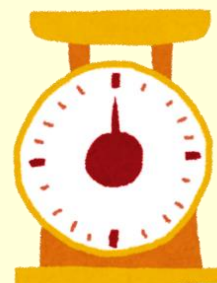
キッチンスケール

※赤外線式体温計・ 耳式体温計や 手首式血圧計など、 検査できない 機種もあります