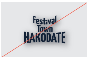
5. 写真上以外でのシャドウを適用しない