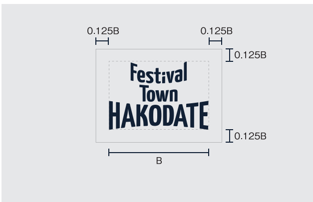
ロゴマークのみ (補足文字なし)

ロゴの識別性や印象を確保するためには、周辺の他の要素から独立するための十分な余白をとる必要があります。その分離スペースの最小基準を「アイソレーションスペース」と呼び、可能な限りこのスペース以上の余白を設けてください。