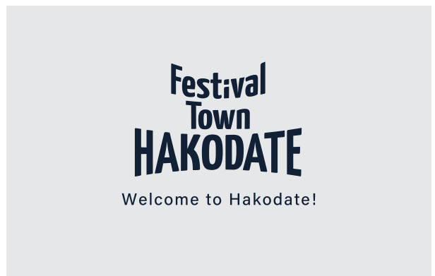
6. ロゴマーク+歓迎メッセージ（英語）