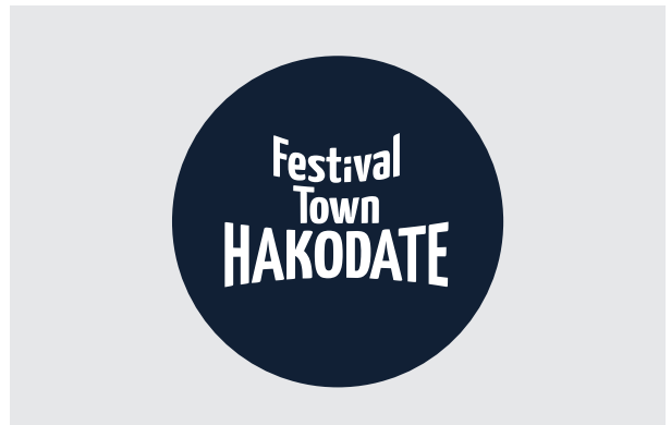
2. サークル（補足文字なし版のみ）