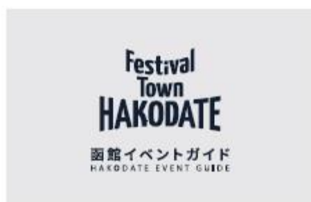
3. ロゴマーク+サイト名