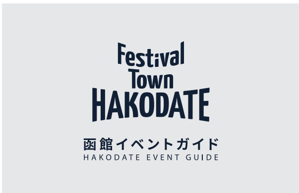
3. ロゴマーク+サイト名