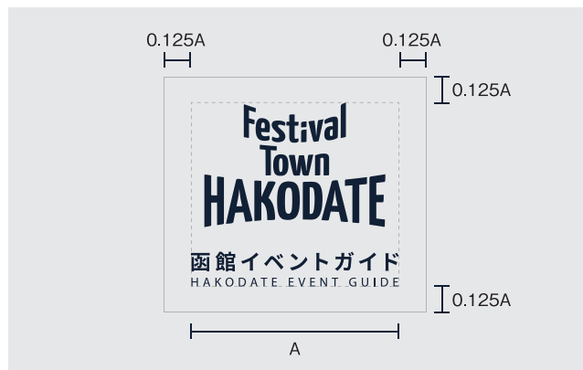
ロゴマーク+補足文字