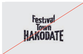
6. テクスチャ等の効果を付与しない