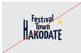
2. デザインの追加 / 変更をしない