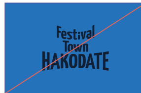
3. 近似色の背景に配置しない