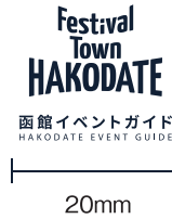
ロゴマーク+補足文字