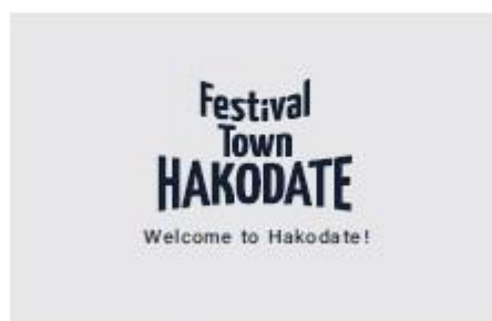
6. ロゴマーク+歓迎メッセージ (英語)