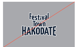
8. アウトラインを使用しない