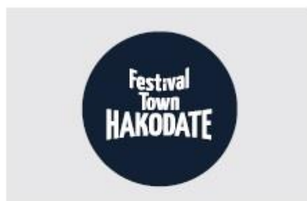
2. サークル (補足文字なし版のみ)