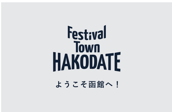
5. ロゴマーク+歓迎メッセージ（日本語）