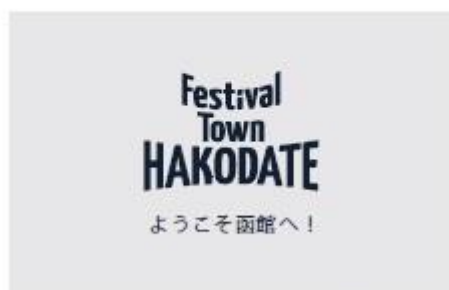
5. ロゴマーク+歓迎メッセージ (日本語)