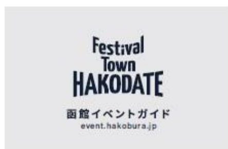
4. ロゴマーク+サイト名+ドメイン名