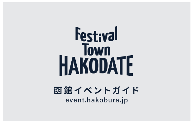
4. ロゴマーク+サイト名+ドメイン名