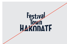
7. トリミングしない