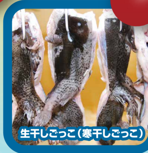
生干しごっこ(寒干しごっこ)