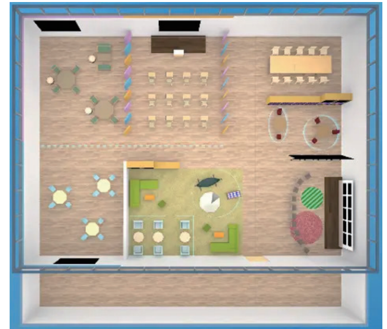
VLPと3Dメタバースのレイアウトのイメージ