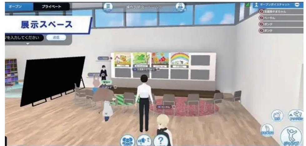
3Dメタバース内でのポスターセッションや面談のイメージ