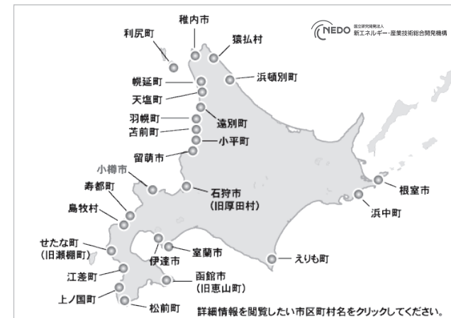
日本における風力発電設備・導入実績(北海道)(2018年3月末現在)