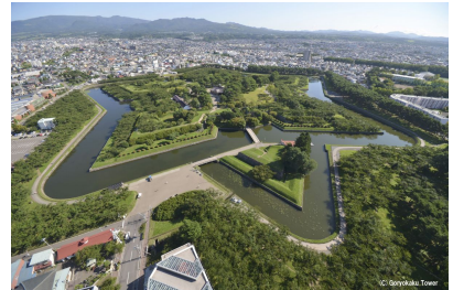
特別史跡「五稜郭跡」