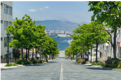
函館で人気のビュースポット「八幡坂」