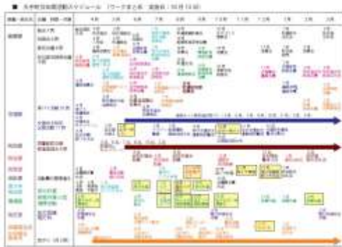
大手町の年間スケジュール