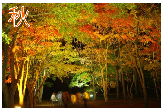
— 見晴公園 —