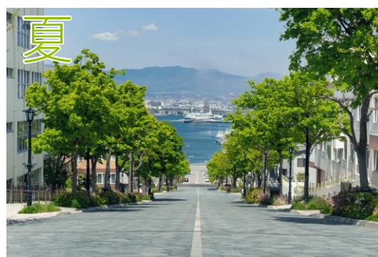
— 八幡坂 —