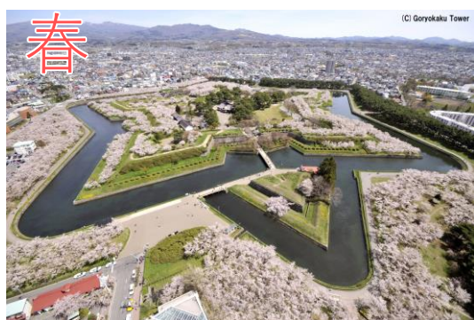
— 五稜郭公園 —