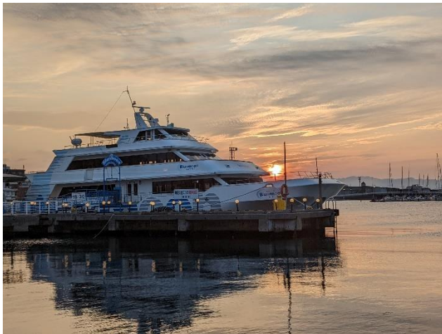
○佳作3 赤い太陽と青い月 白鳥 珠羽