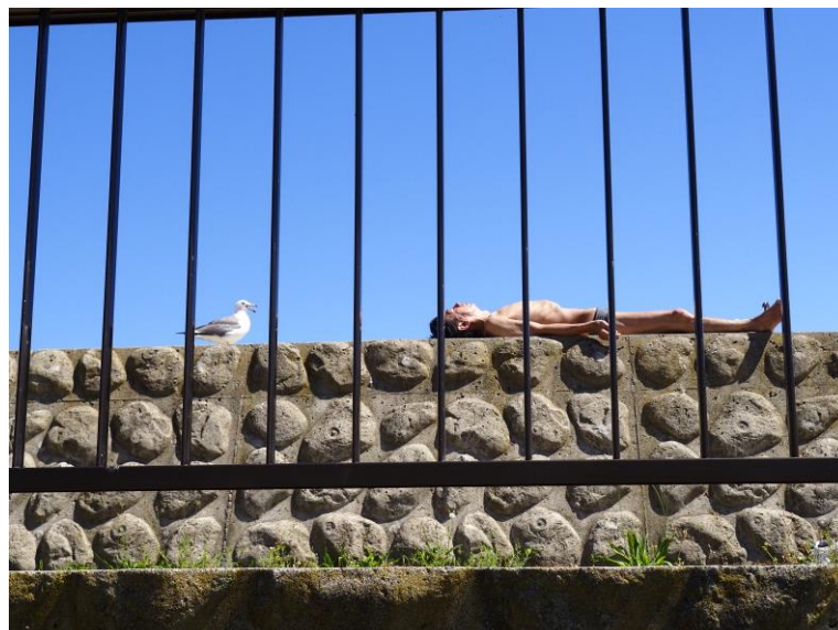
○優秀賞 カモメと男 佐々木 孝