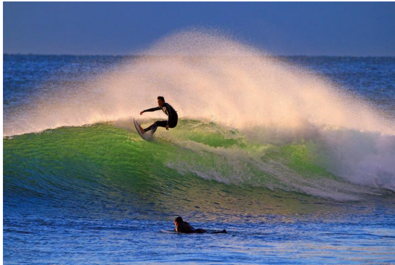
○特別賞（朝日新聞北海道支社賞） 朝陽を浴びて 渡部 啓二