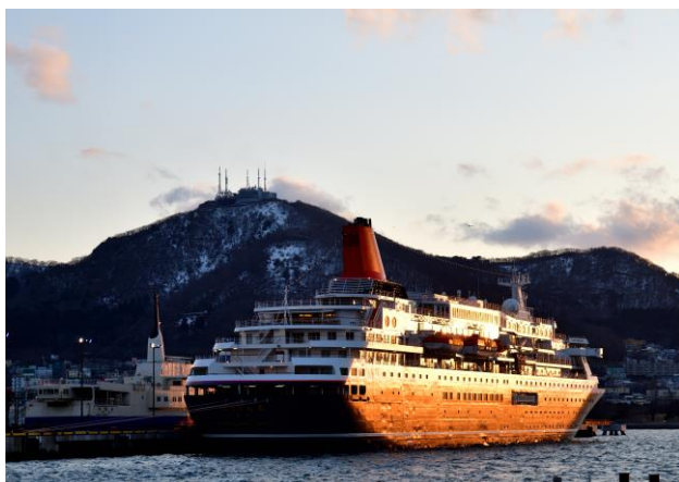
○入選5 夕陽を浴びて 山口 健一