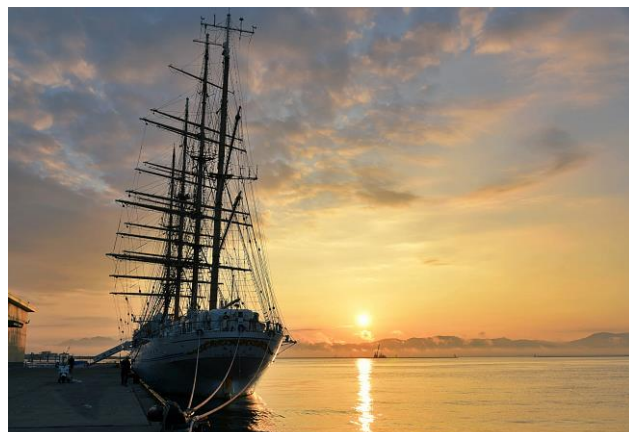
○入選4 夕映え海の貴婦人 岩本 一志