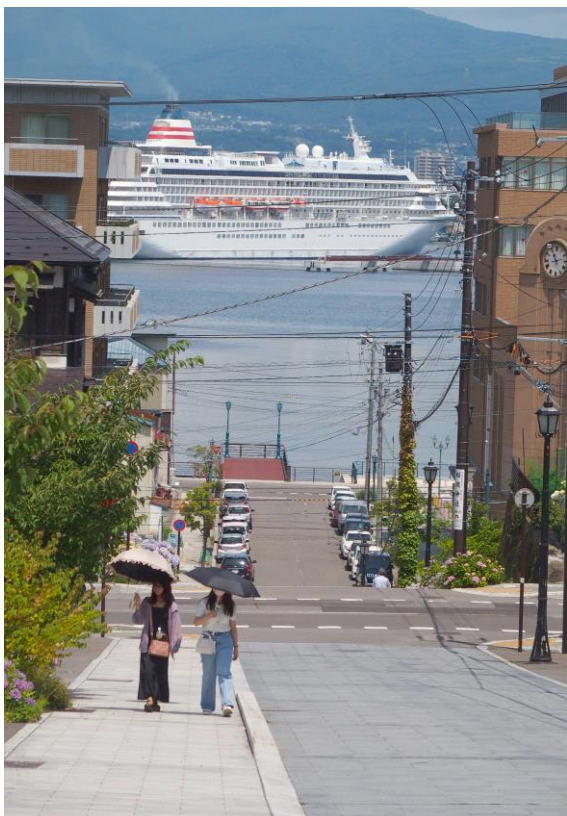
○最優秀賞 クルーザー入港 伊賀 嘉樹