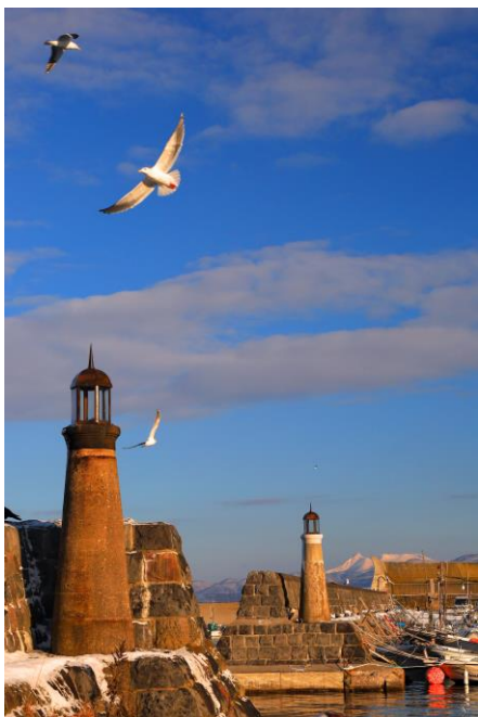
○入選1 朝日を浴びて 渡部 啓二