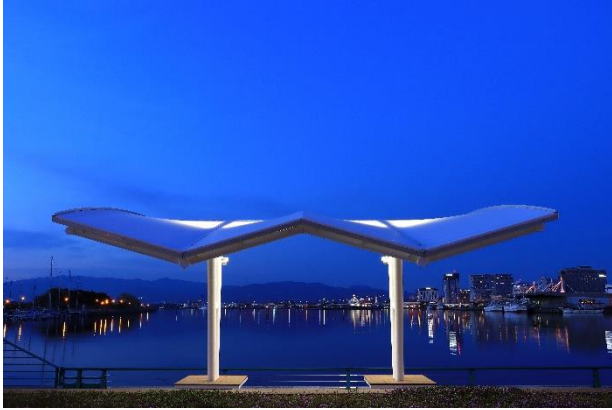
○佳作1 港の光彩 翼の中に 岩山 優光