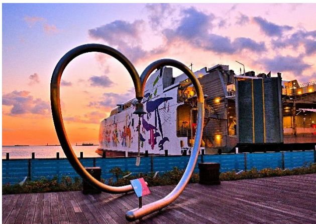
○佳作5 茜色の港 竹田 徹夫