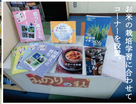
お米の栽培学習に合わせたコーナーを設置。