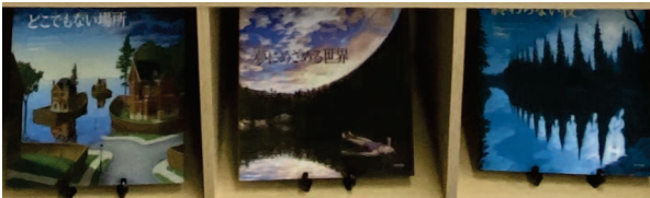
(夢に出そうな怖い感じのトリックアート。音楽の授業「魔王」で使ってます。)

書店に行くとはただ眺めるだけのつもりが気がつけば何冊も抱えてレジへ…。自宅の本棚も家が傾かないか不安。というくらい本のお世話になっています。本の思い出と言えば、小学生の時に定期購読した学研の「学習」と「科学」。夏休みには付録の読み物特集を何回もくり返し読んでいました。今でも化け猫の怪談は良く覚えています。買ってもらった本はずっととっておくので、6年間分がすべて棚に並んでいました。また、社会科の地図や昆虫が大好きで、誕生日プレゼントには日本地図、世界地図、昆虫図鑑などを買ってもらいました。当時、仲間同士で切手集めもはやっており、切手や郵便の関連図書を買ったり、公共の図書館に借りに行きました。学習関連書以外にも漫画の週刊誌やゲーム雑誌などいろいろ読んでいました。