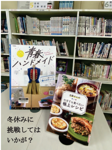
冬休みに挑戦してはいかが？