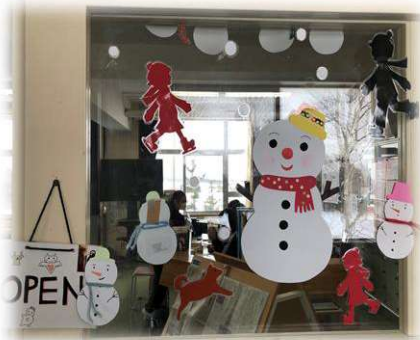
文化委員や特別支援学級の生徒が季節や行事に合わせて 装飾 作成。