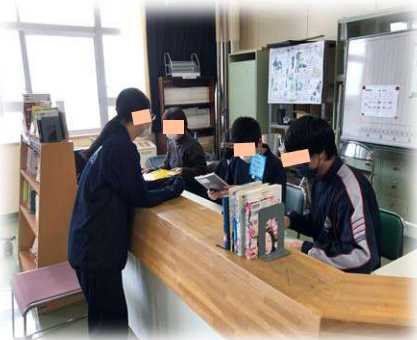
昼休みは、文化委員が 図書 の貸し出し・ 管理 を交互に担当。