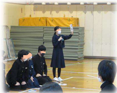
委員会発表 でおすすめ図書を紹介