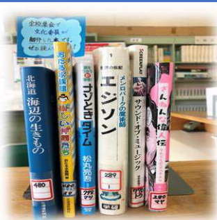
全校集会で紹介した おすすめ図書コーナー