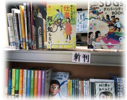
リクエスト をもとに学校司書・司書教諭・委員会メンバーで決める 新刊図書 。