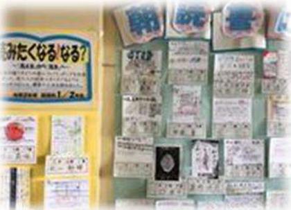
4月:国語科授業で、2・3年生から 新1年生 へ朝読書 おすすめ図書 紹介。