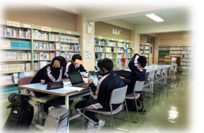
放課後図書館開放 (月・木はおもに校長、火は司書が担当)。