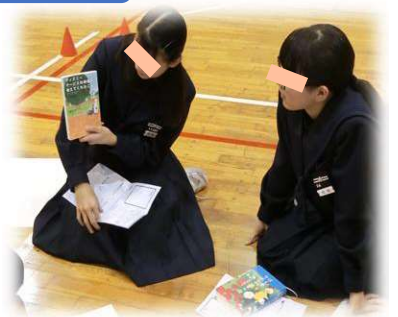
ブックトーク 集会(読書感想交流会) *写真はR1年度