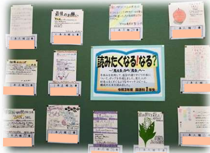
1月:国語科授業で、1年生が 2・3年生 にお気に入りの 図書 紹介。