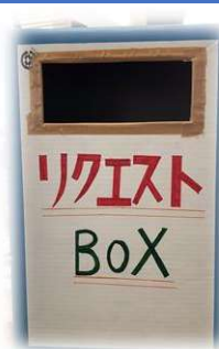
積極的活用を呼びかけた リクエストBOX