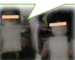
ポップで本の紹介！