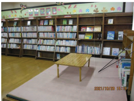
くつろぎスペース