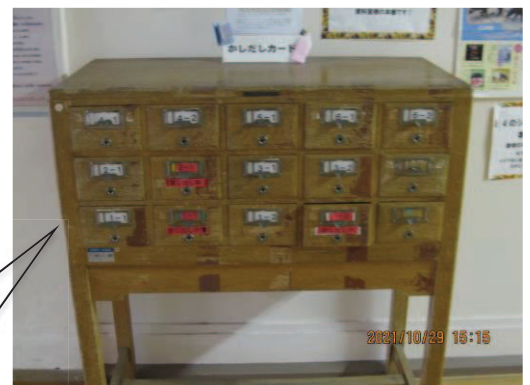
図書貸し出しカード入れ