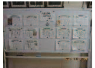
先生方のお勧めの本