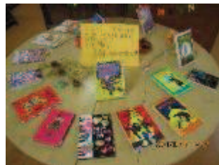
季節の本コーナー