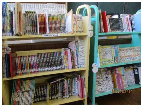
新刊コーナーの様子

新刊コーナーでは、寄贈・新規購入図書を紹介。本校図書館は歴史関係の本が充実しています。