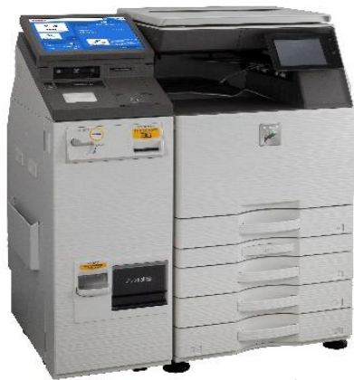
戸籍等証明書自動交付機