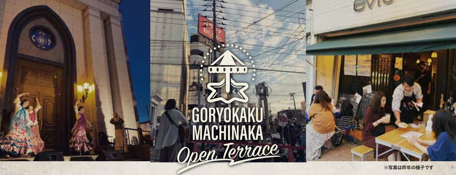
※写真は昨年の様子です