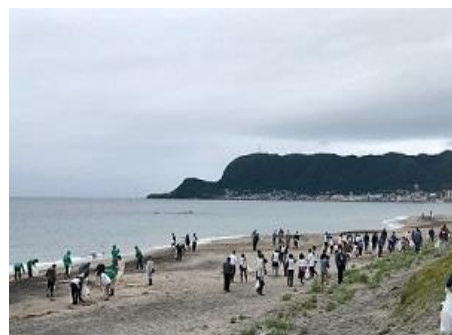
清掃活動(大森浜環境美化活動)