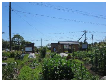
函館市空港ふれあい菜園