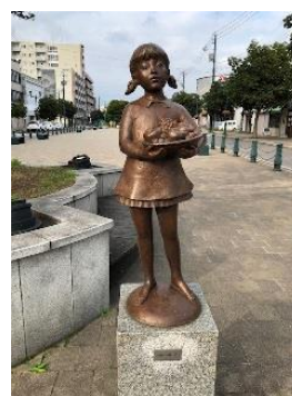
『函館の妖精 秋』(グリーンプラザ)