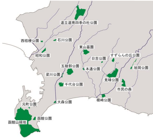
図3-27 主な都市公園位置