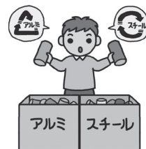
アルミ缶・スチール缶