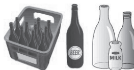
リターナブルびん