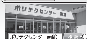
ポリテクセンター函館