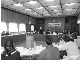
▲戸井地域審議会の様子

第3回地域審議会を、2月18日・25日に各支所で開催し、事務局から前回会議の意見等の集約結果と取組状況などについて説明があったほか、合併建設計画の執行状況や地域振興全般について意見交換が行われました。