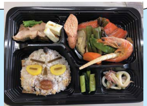
中空土偶弁当(イメージ) 1,000円(お茶付)