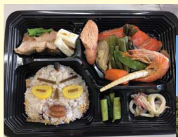
中空土偶弁当 (イメージ) 1,000円 (お茶付)