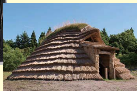
大船遺跡の復元住居