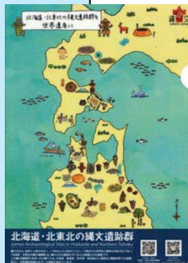
特製クリアファイル(非売品)