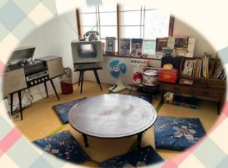
写真はレトロ喫茶 昭和館内の様子です