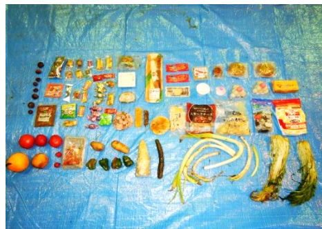
写真：令和4年度食品ロス実態調査

※2 直接廃棄とは、購入後全く手が付けられずに捨てられたもの。未使用・未開封の食品。