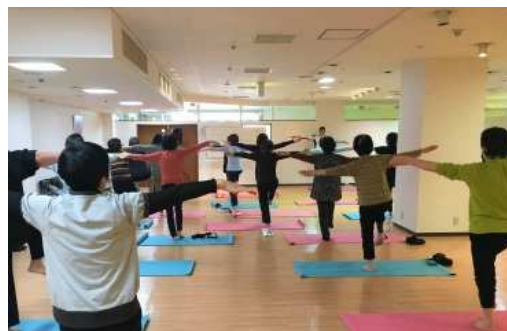
健康体操教室の様子