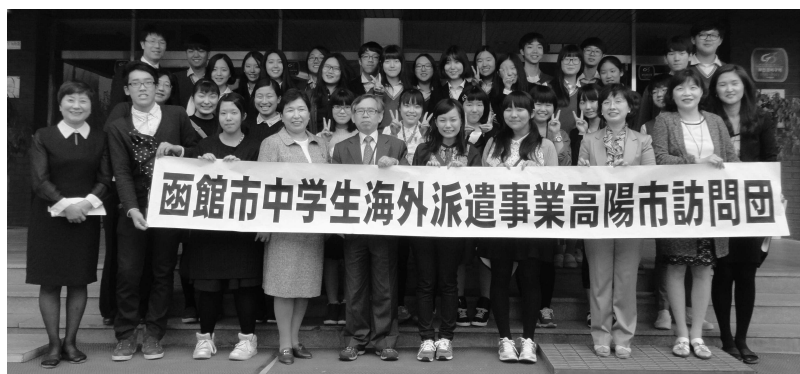
平成27年度 高陽市訪問団