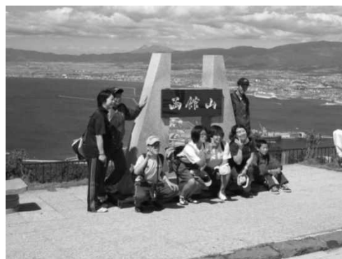
合同宿泊学習「函館山登山」