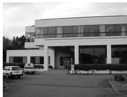
更衣室(男女別), 事務室, 控室