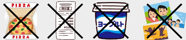
汚れの付いているもの 感熱紙 防水・ワックス加工のもの 写真

※汚れの付いているものやビニールなどでコーティングされた上記のものは燃やせるごみに出してください。