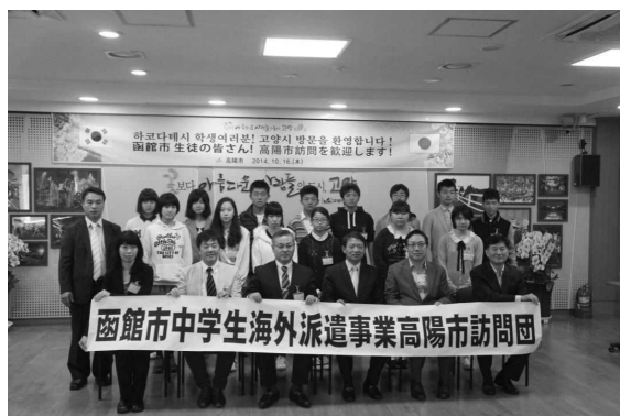
平成26年度 高陽市訪問団