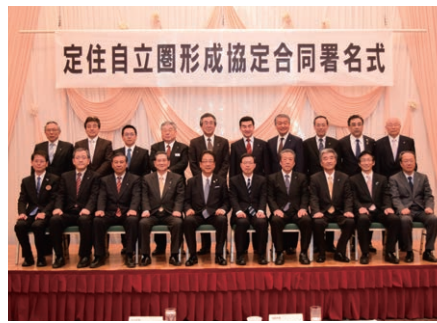
渡島・檜山管内17市町との定住自立圏形成協定を締結しました。