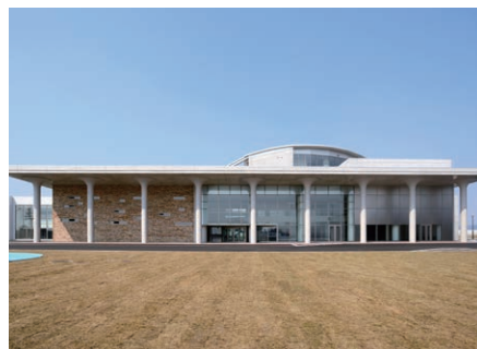
函館国際水産・海洋都市構想のシンボル「国際水産・海洋総合研究センター」がオープンしました。