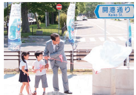
朝市～ベイエリア間の道路が「開港通り」と命名されました。