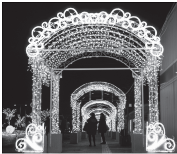
函館駅前のイルミネーション

このほか、「市民の安全・ 安心」に関する取組みとして、 子どもからお年寄りまで、障 がいの有無に関わらず、誰も がいきいきと希望をもつて暮 らせる「福祉コミュニティエ リア」の整備に向け検討を進 めているほか、道南18市町に よる定住自立圏の事業とし