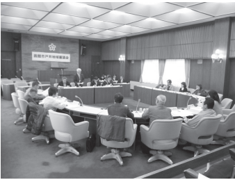
▲戸井地域審議会の様子