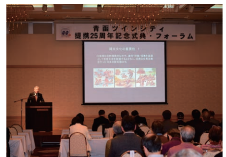
青森市とのツインシティ提携25周年を記念して式典・フォーラムを開催しました。