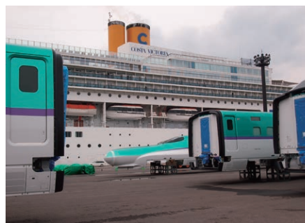
北海道新幹線の車両が函館港に陸揚げされ、今年最多入港したクルーズ客船と共演しました。