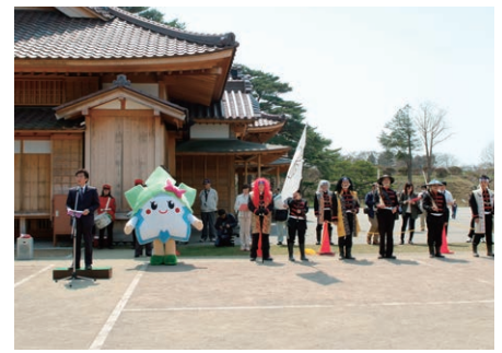
五稜郭築造150年祭が開催され幕末の衣装を着た市民が「おもてなし隊」として活動しました。