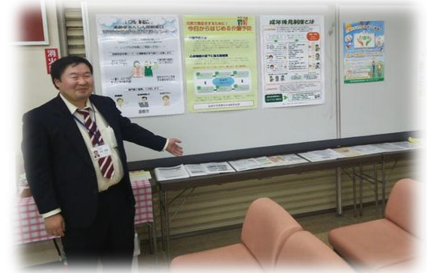
銀行ロビーでの パネル展示