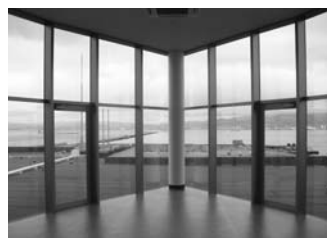
4階展望ロビーからの眺め