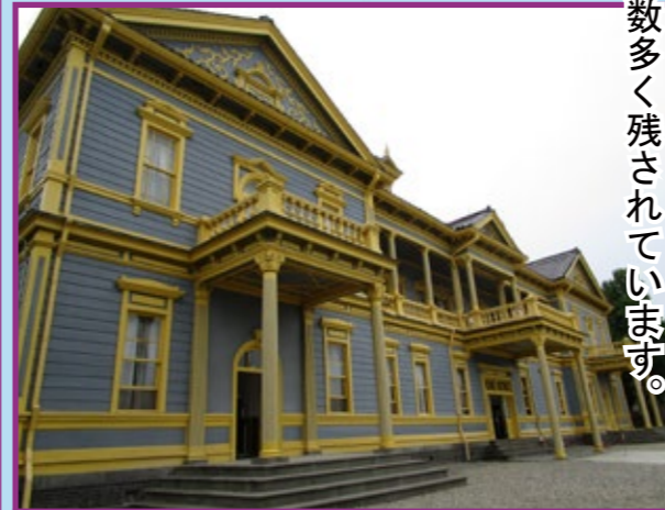
31-1・2 旧函館区公会堂