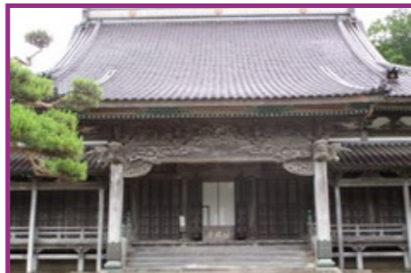
7 高龍寺 本堂