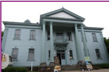
33 旧北海道庁函館支庁庁舎