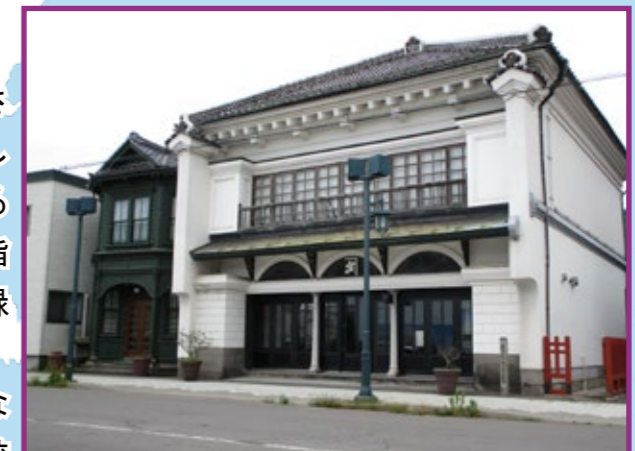
24 太刀川家住宅店舗

特に元町や末広町などには歴史的、文化的に重要な建築物も多く、これらは、文化財保護法に基づき伝統的建造物として指定されており、これらを取りまく地域を伝統的建造物群保存地区として指定しています。