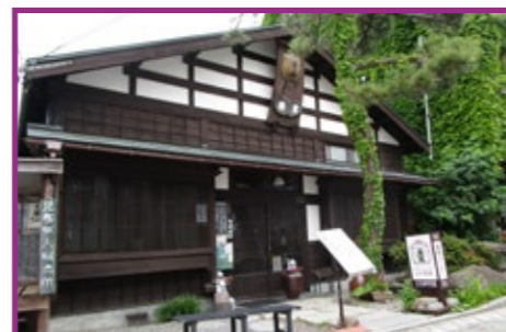
35 茶房 菊泉