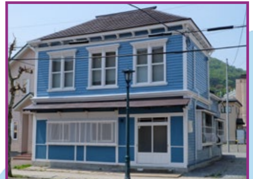
11 旧大洋漁業函館営業所