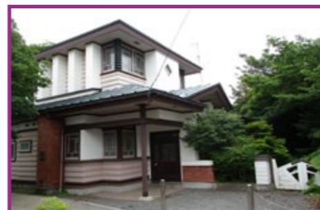
50 プレイヤーハウス