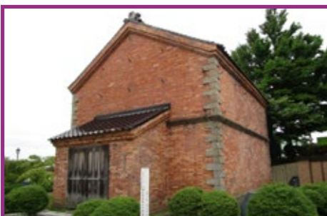
32 旧開拓使函館支庁書籍庫