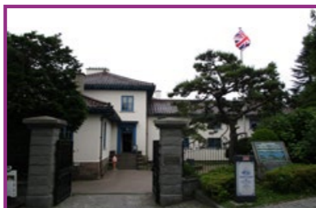
57 開港記念館(旧イギリス領事館)