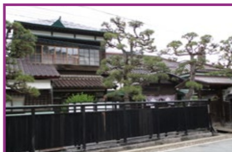
62-1・2・3・4 旧相馬家住宅