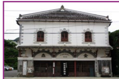
40 市立函館博物館郷土資料館