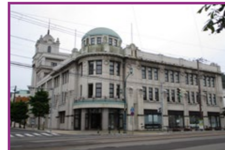
37 函館市地域交流まちづくりセンター