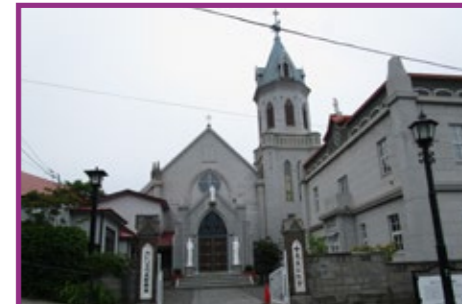
40-1・2・3・4 カトリック元町教会