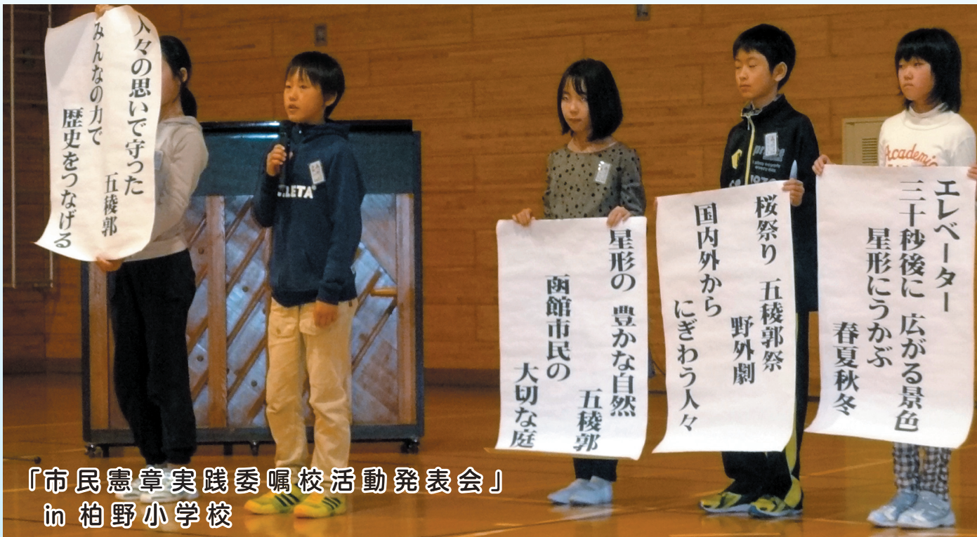
「市民憲章実践委嘱校活動発表会」 in 柏野小学校