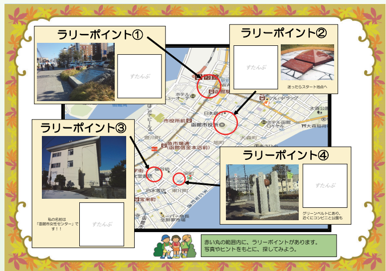
スタンプシート【縮小版】

開催にあたっては、何かと至らない点もあったことと思いますが、皆様方のご協力もあり、滞りなく終了することができました。スタッフ一同感謝申し上げます。