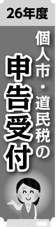
表1のとおり受付します。