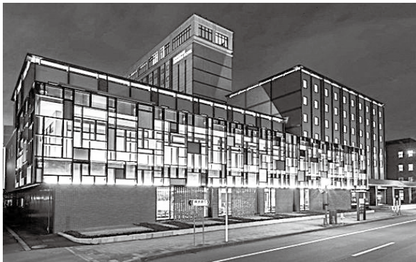
第29回受賞 函館国際ホテル

都市景観に配慮した優れた建物やより良い景観づくりのための活動をしている団体・個人等を募集します。自薦・他薦は問いません。