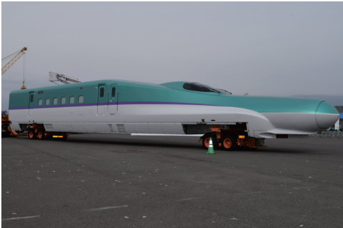
新幹線車両の陸揚げ