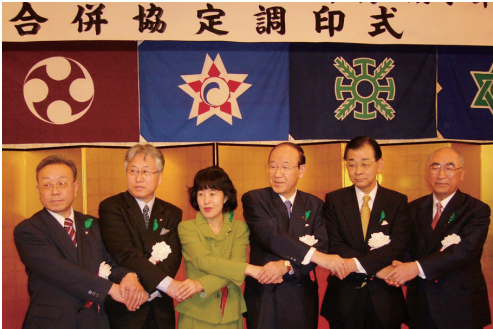
3町1村との合併協定調印式