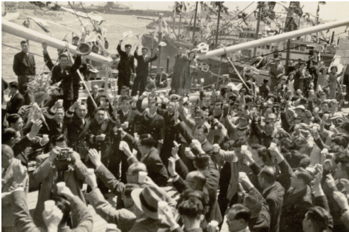
北洋漁業の出漁見送り風景