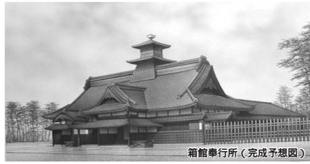
箱館奉行所（完成予想図）

北消防署亀田本町支署庁舎等改築主体その他工事 消防組織機構再編計画に基づき消防車両の増強など消防力を強化するため改築するもので、建物の構造・規模は鉄筋コンクリート造2階建、延べ床面積1081・68㎡、請負金額は1億9929万円です。 特別史跡五稜郭跡内箱館奉行所庁舎復元工事