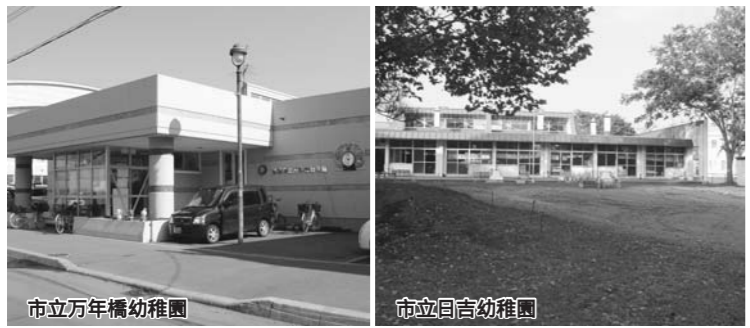
市立万年橋幼稚園

(答弁者 教育長) その他の主な質問項目 医療制度 青年の雇用対策 障がい児教育