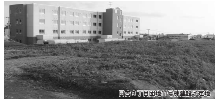
日吉3丁目団地11号棟建設予定地

平成18年度から平成19年度までの2か年継続事業により市営住宅を28戸建設するもので、建物の構造・規模は鉄筋コンクリート造5階建、述べ床面積は2455・51㎡、請負金額は2億4066万円です。