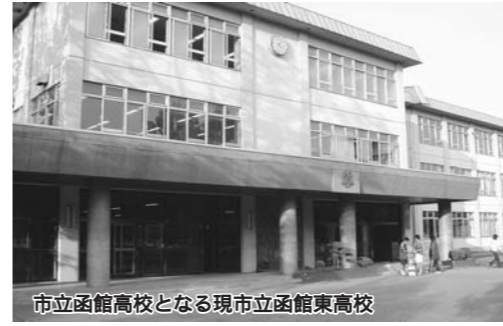
市立函館高校となる現市立函館東高校

函館東高等学校と函館北高等学校を統合し、市立函館高等学校を設置するもので、施行期日は平成19年4月1日とするものです。