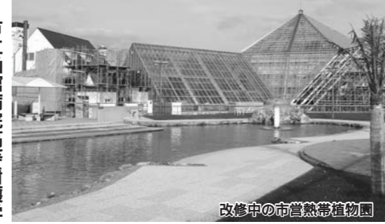
改修中の市営熱帯植物園

市営熱帯植物園の管理に指定管理者制度を導入することに伴い規定を整備するもので、施行期日は平成19年4月1日です。