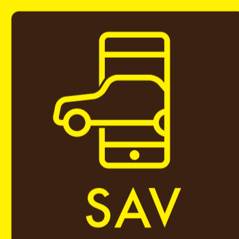
乗り合いタクシー