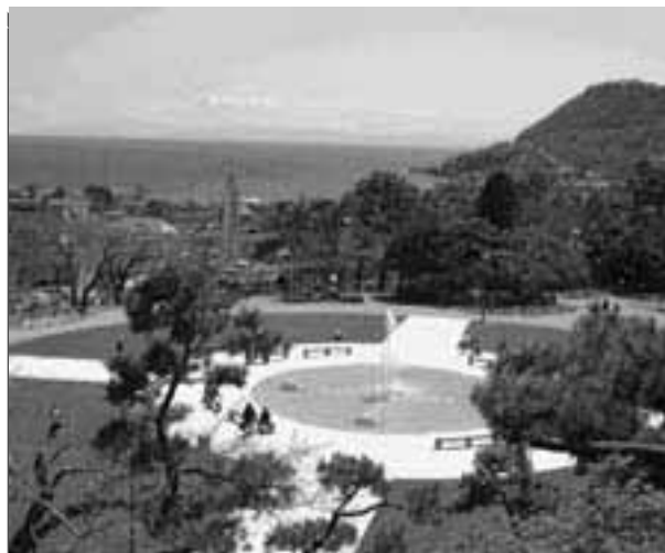
函館公園(登録記念物 名勝地)