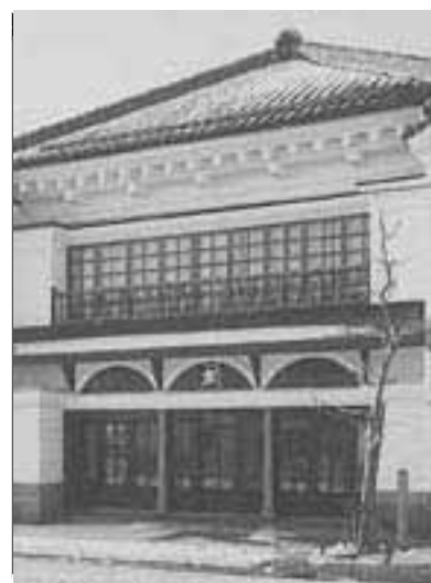
太刀川家住宅店舗