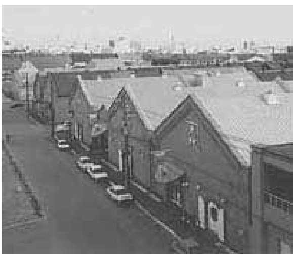
函館市元町末広町伝統的建造物群保存地区