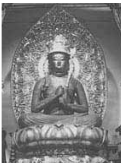
木造大日如来坐像