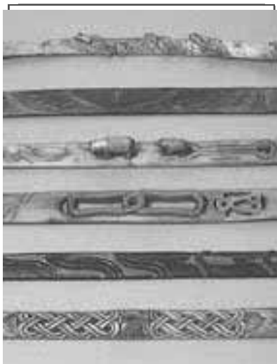
アイヌの生活用具コレクション