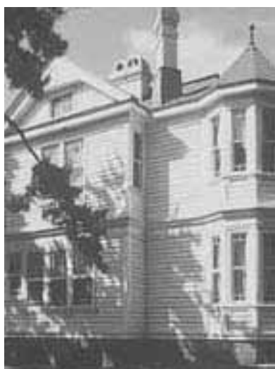
遺愛学院(旧遺愛女学校)旧宣教師館