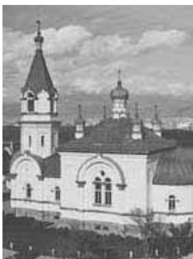
函館ハリストス正教会復活聖堂