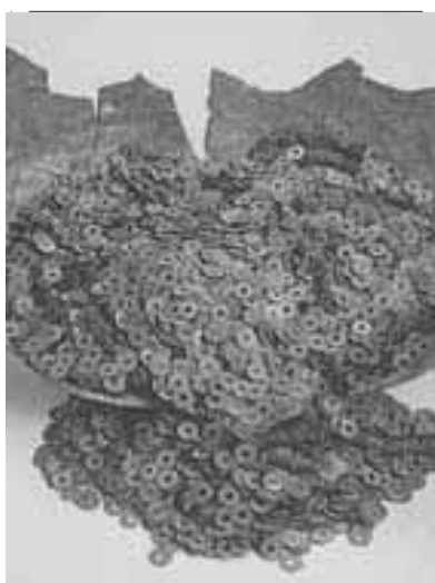
北海道志海苔中世遺構出土銭