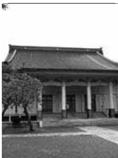
大谷派本願寺函館別院(本堂)