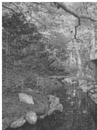
旧岩船氏庭園(香雪園)