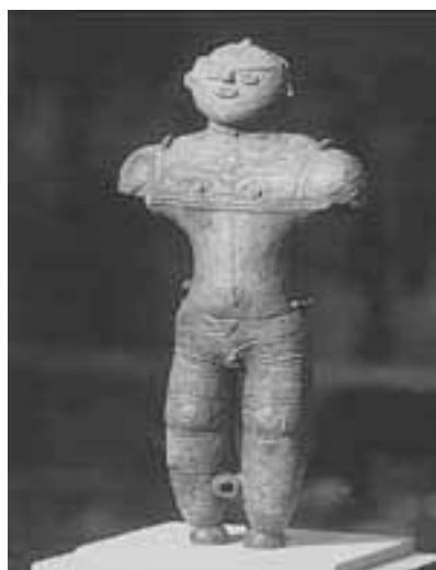
土偶(著保内野遺跡)