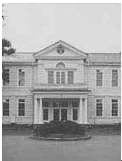
遺愛学院(旧遺愛女学校)本館