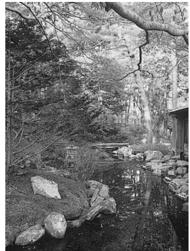
旧岩船氏庭園(香雪園)