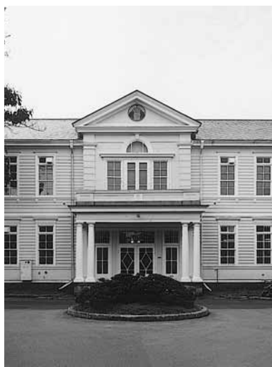
遺愛学院(旧遺愛女学校)本館