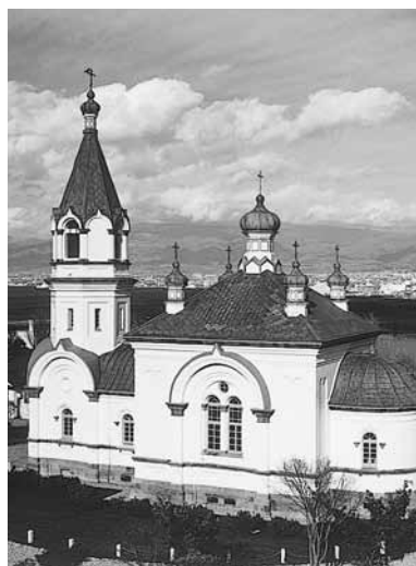
函館ハリストス正教会復活聖堂