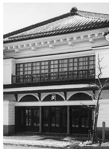
太刀川家住宅店舗