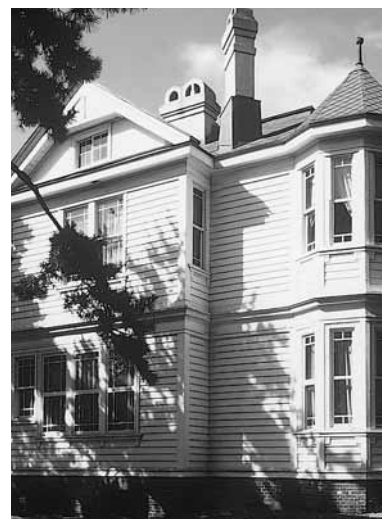
遺愛学院(旧遺愛女学校)旧宣教師館