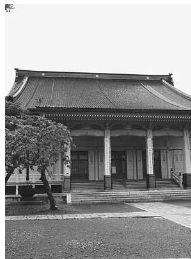
大谷派本願寺函館別院(本堂)