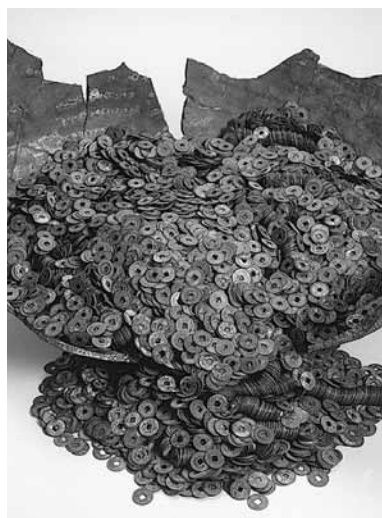
北海道志海苔中世遺構出土銭