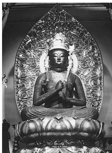
木造大日如来坐像