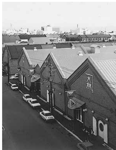
函館市元町末広町伝統的建造物群保存地区