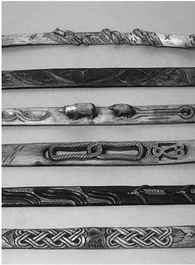
アイヌの生活用具コレクション