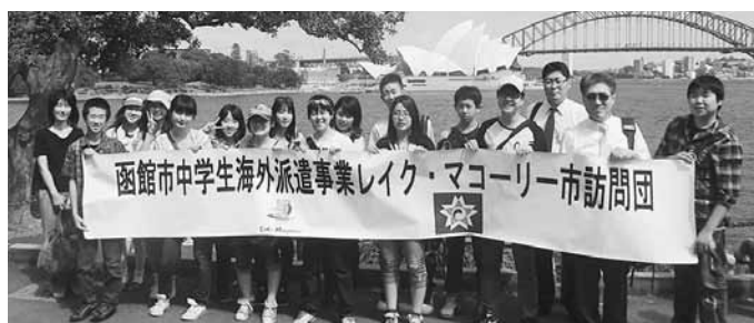
平成23年度 レイク・マコーリー市訪問団（オペラハウスとハーバーブリッジ）