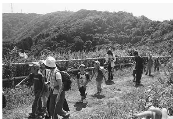
合同宿泊学習「函館山登山」