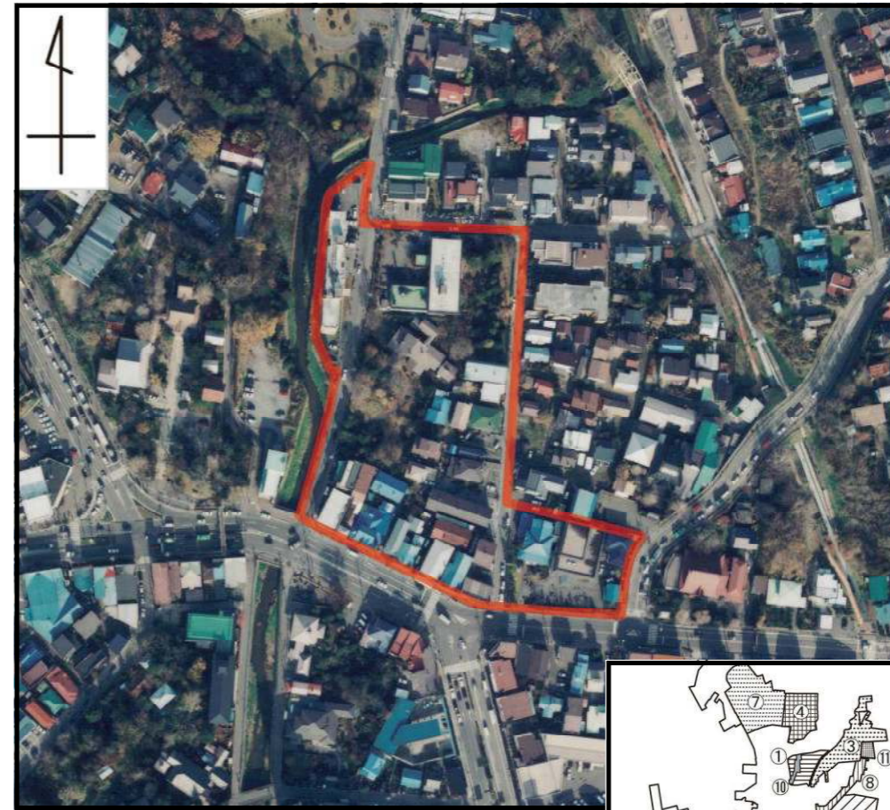
湯川橋地区 ～施行前～ (平成12年撮影)