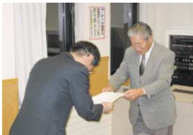
素案に関する意見書の受領状況写真