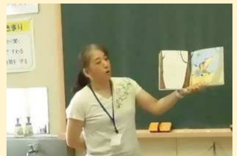
読み聞かせ活動の様子