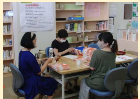
図書ボランティア活動の様子