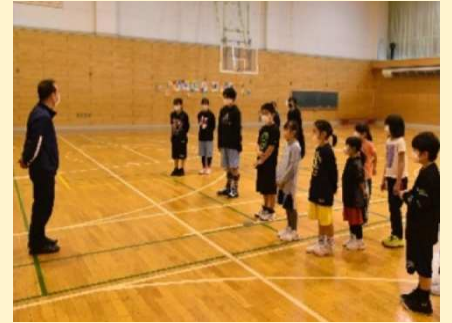
ミニバスケットボール教室の様子