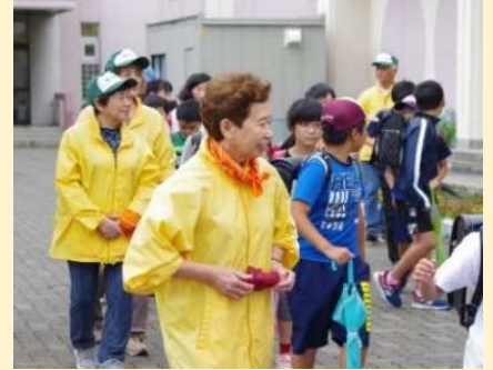
見守り活動の様子